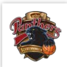
wiha Panthers Schwenningen