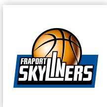
FRAPORT SKYLINERS Juniors