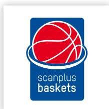
scanplus baskets Elchingen