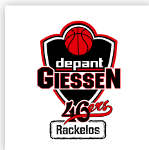
depant GIESSEN 46ers Rackelos